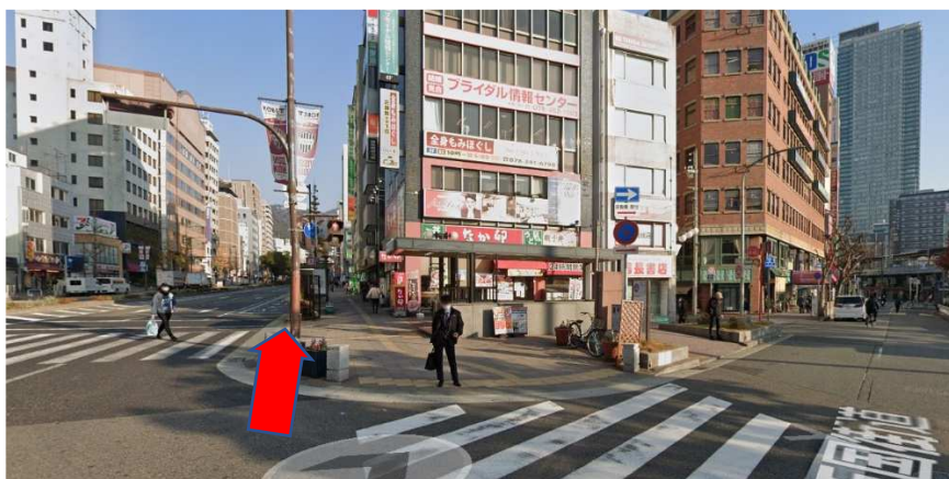
右手に「なかつ」が見えます。