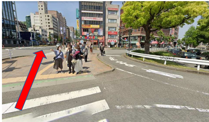
短い、横断歩道を渡ります。