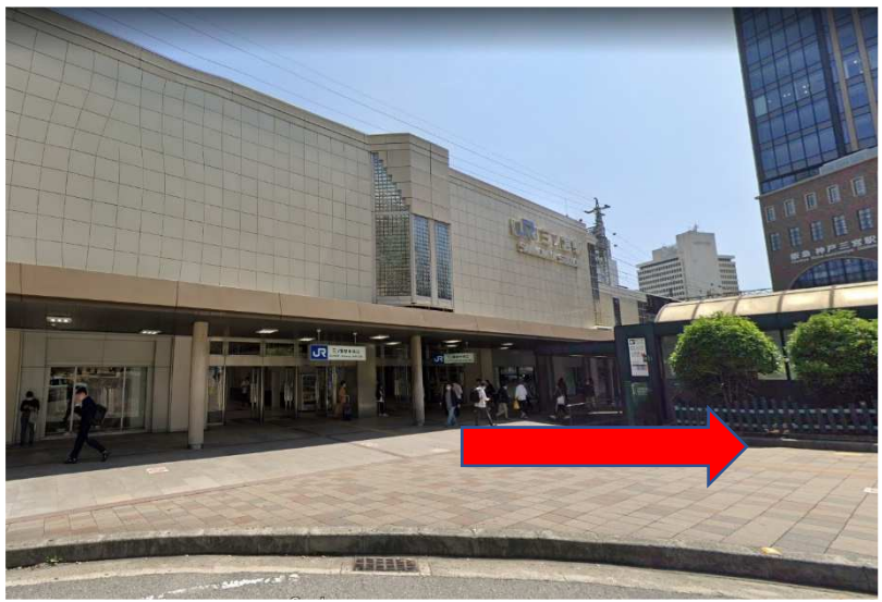
JR 三宮駅・中央改札・北口 付近

JR 三宮駅中央口を出たらすぐ右側の出口へ（＝山側）。出口を出たら右斜めに見える大きな道を山に向かって歩いてください。横断歩道を渡ると右手に「なか卯」が見えます。