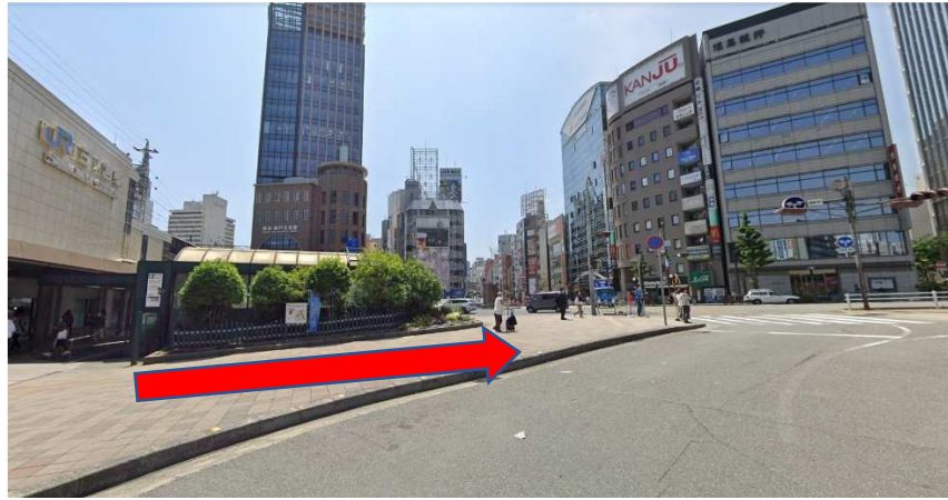
北口を出たら、右斜めの大きな道路に向かって歩きます。