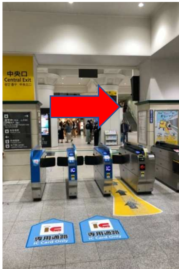
中央改札を出て右（北口）へ